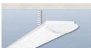
RichLED Sumina mit Abhängung ZZR optional